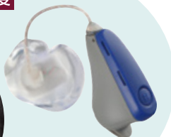
(オーダーイヤチップ)