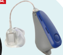
(オーダーイヤチップ)