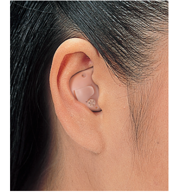
販売名 補聴器HI-89 医療機器認証番号 222AABZX00198000