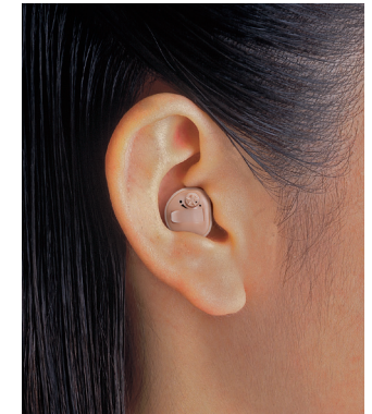
販売名 補聴器HI-86 医療機器認証番号 220AABZX00119A01