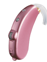
ピンクサファイア