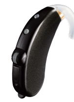
プレミアムブラック