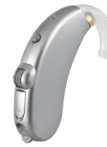
プラチナシルバー