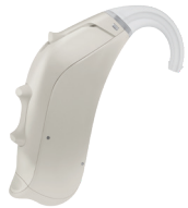
フレッシュブルー