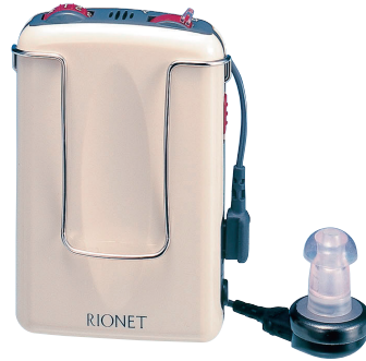
販売名 補聴器HA-76 医療機器認証番号 219AABZX00198000