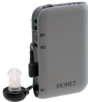
販売名 補聴器HD-34H 医療機器認証番号 303AABZX00058A01