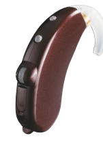
コーヒーブラウン