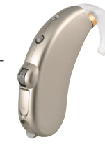
シャンパンゴールド