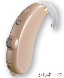
シルキーベージュ