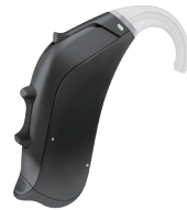
シャドーブラック