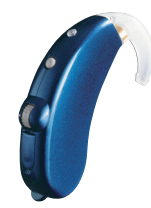
ブルーサファイア